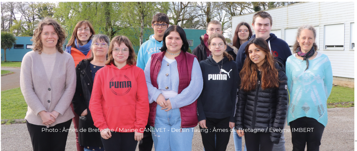
Dessin Taurig : Âmes de Bretagne / Évelyne IMBERT