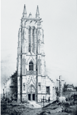
Lithographie de Mayer et Petit - « Voyages pittoresques et romantiques dans l'ancienne Bretagne » du Baron Taylor

Vous vous trouvez devant l'église de Carhaix, et les élèves de l'école de l'Enfant-Jésus vous ont concocté un texte et un petit jeu, pour en apprendre plus.