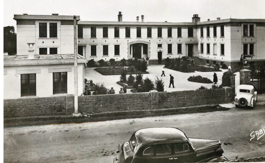
Photo de l'hôpital vers 1930 : carte postale ancienne.

«Plusieurs d'entre nous sont nés ici. Mais la maternité a failli fermer. Grâce à la détermination des Carhaisiens et de la population des alentours, elle a été maintenue ouverte. Des manifestations ont eu lieu pour son maintien. Depuis, un objet est devenu le symbole de la lutte pour la défense de l'hôpital. Quel est-il?» (La réponse se situe en bas de la page 🙌)